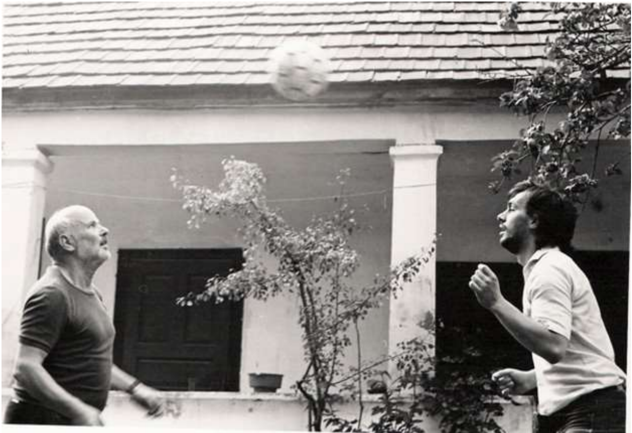
Eörsi István és Orbán Viktor, Peröcsény, 1989. június vége.

Nem akarok Ginsberg költői nagyságáról beszélni. Arról, hogy valaki mennyire tehetséges, nem tehet. Ellenben tévedhetetlen erkölcsű ember volt. Egy sziklás-hegységbeli kis egyetemi városban, ahol buddhista egyetemen politikát tanított, egyszer azt mondja nekem, hogy hát a legjobb díszköltőnk már nem is én vagyok, hanem Gregory Corso. Amikor megismerkedtünk, mondta, épp aznap szabadult a fiatalok börtönéből. Megmutattuk egymásnak a verseinket, és rögtön vittem is Ferlingetihez, aki akkor könyvkiadó volt. Ferlingetivel csak az a baj, hogy folyton meglop, mondta. Mondom neki, hát akkor hogy tudsz vele barátkozni. Megállt elém, jön, szembefordul velem, kigúvad a szeme, és azt mondta: Miket beszélsz?! Kiszámítottam, 30 000 dollárt lopott 30 év alatt. Évi ezer dollár nagy pénz egy ilyen jó barátságért?